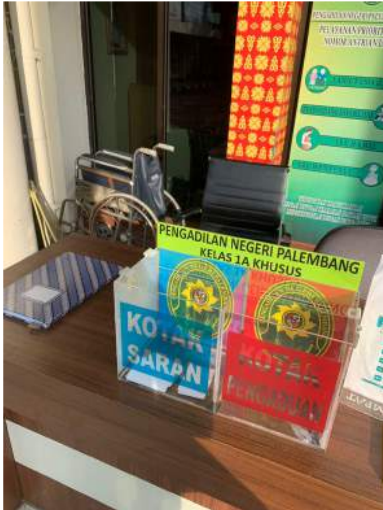
KOTAK SARAN DAN KOTA PENGADUAN