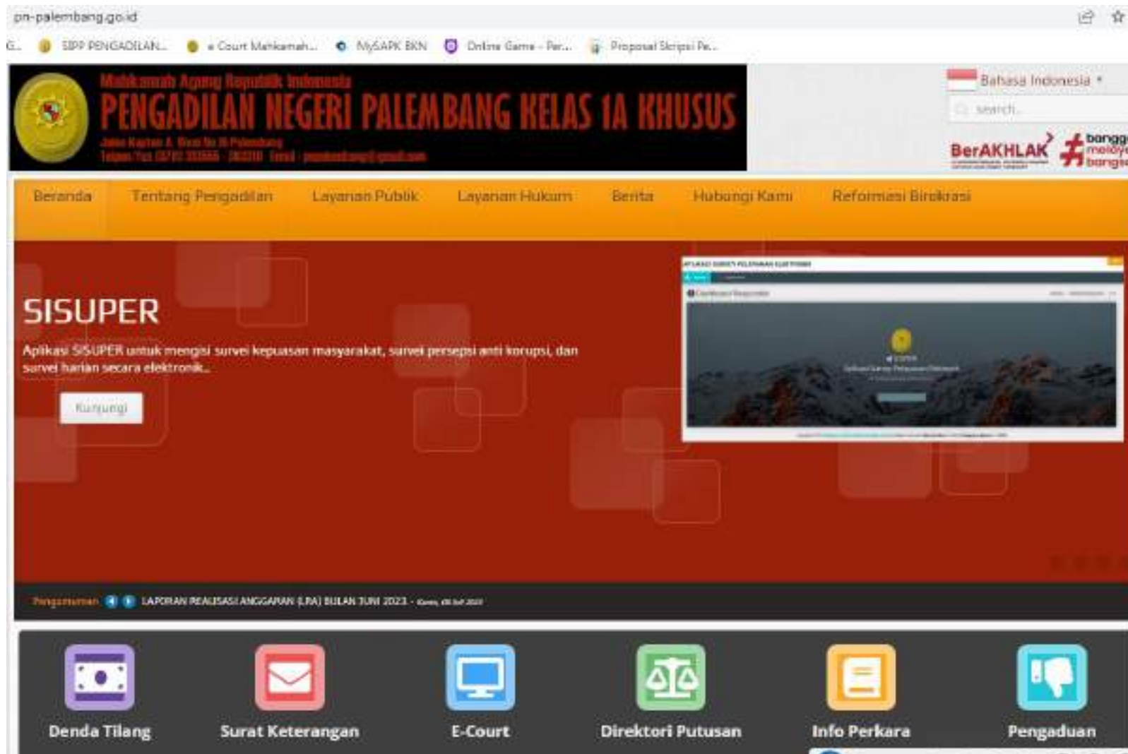
WEBSITE PENGADILAN NEGERI PALEMBANG