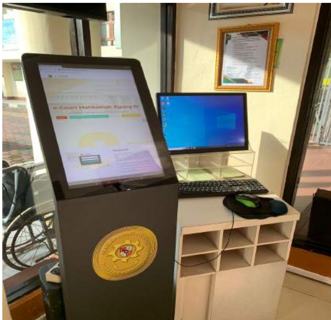
MONITOR PADA RUANG PTSP