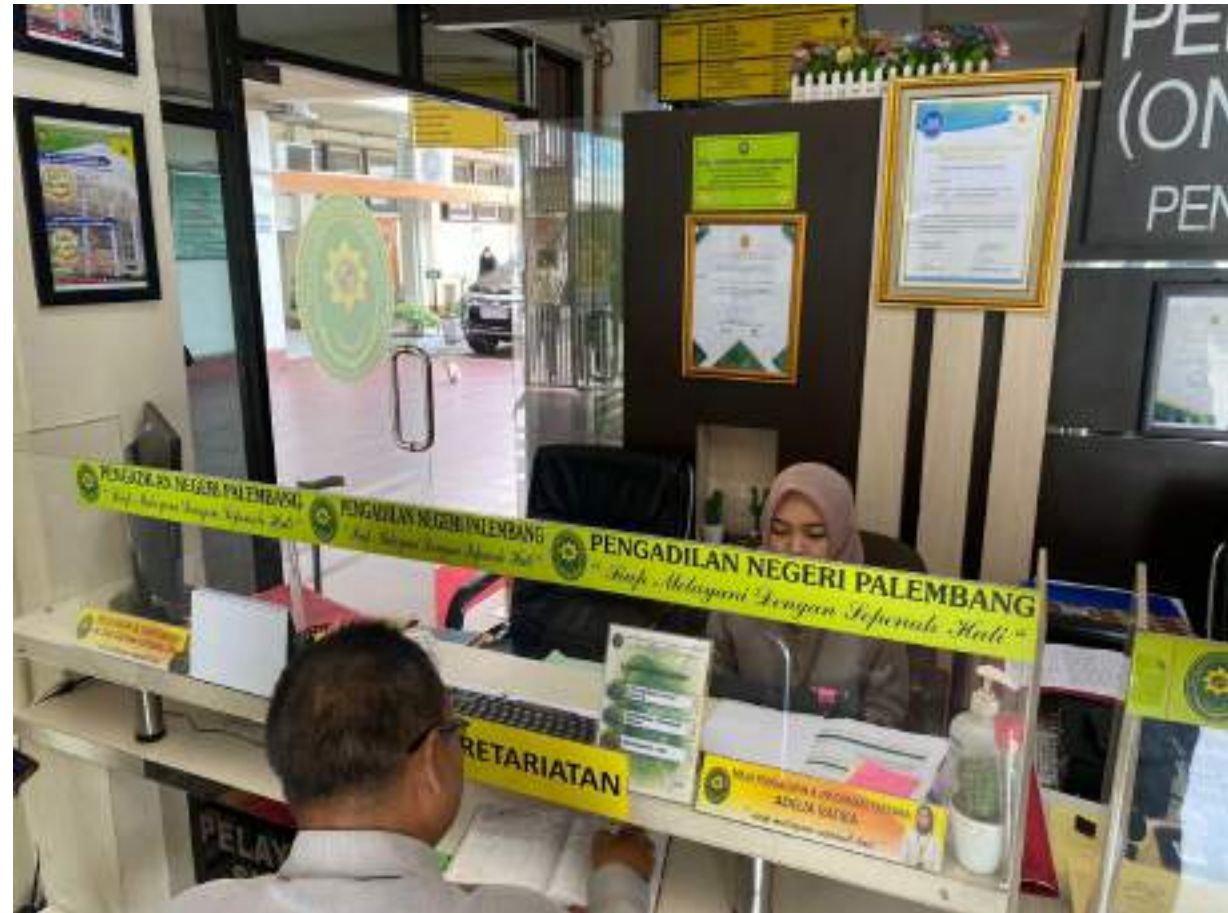
MEJA INFORMASI DAN PENGADUAN PADA RUANG PTSP